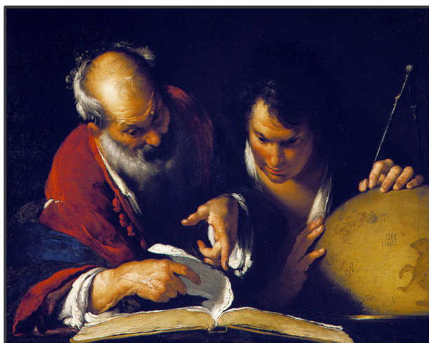
Bernardo Strozzi (1581-1644), Eratosthène enseignant à Alexandrie (1635) Montreal Museum of Fine Arts

Mercredi 19 novembre, 14h15–15h45 HEP – Avenue des Bains 21, salle 313